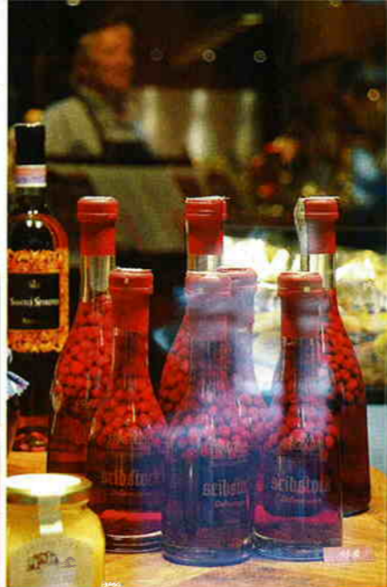
Boven: Delicatessen in een huis van vertrouwen hartje Bolzano.