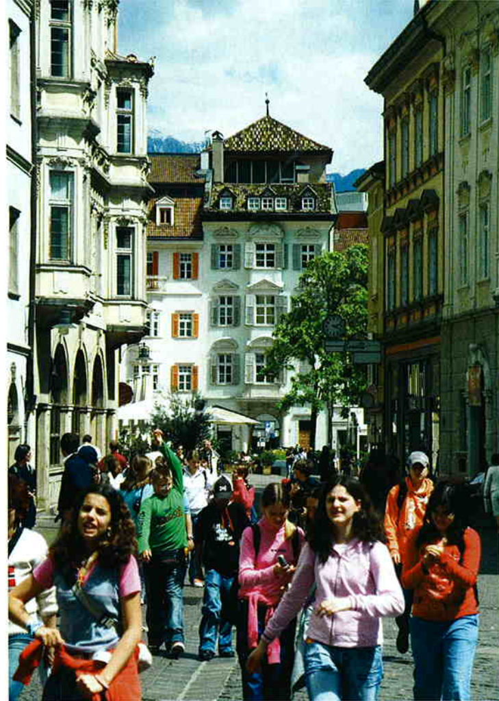
De levendige wandelstraten van verkeersvrij Bolzano.

Dolomieten Super Ski, twaalf aaneengesloten ski-gebieden met 1.200 kilometer skipistes en 450 liften, www.suedtirol.info/winter