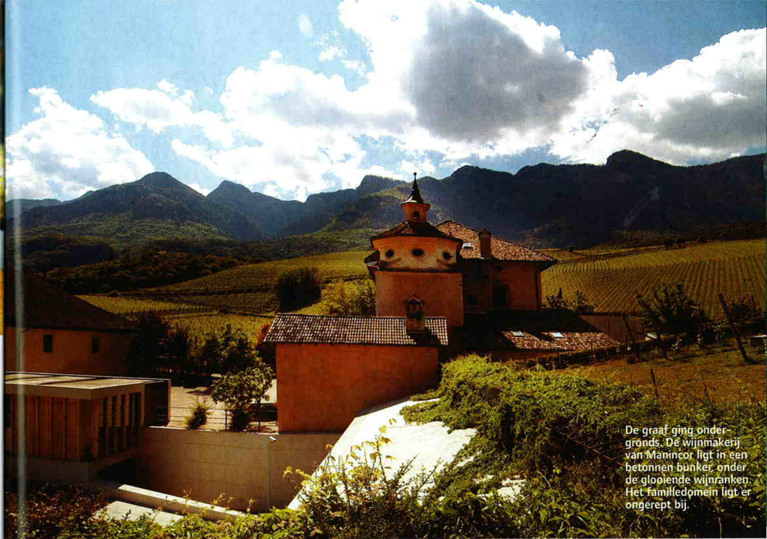
De graaf ging ondergronds. De wijnmakerij van Manincor ligt in een betonnen bunker, onder de gloeiende wijnranken. Het familiedomein ligt er ongerept bij.

"We plukken met de hand en chemicaliën zijn uit den boze. De vermalen kwartskristallen versterken de planten, net zoals kamillethee of brandnetelgier." De biodynamische zienswijzen van de wijnmaker hebben een zeker geitenwollensok-